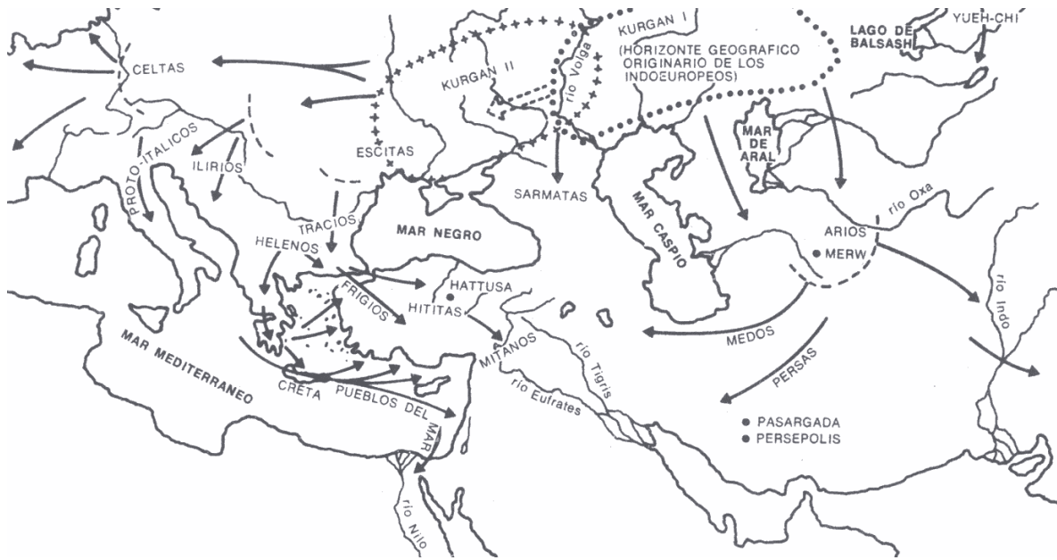
El mundo indoeuropeo originario.